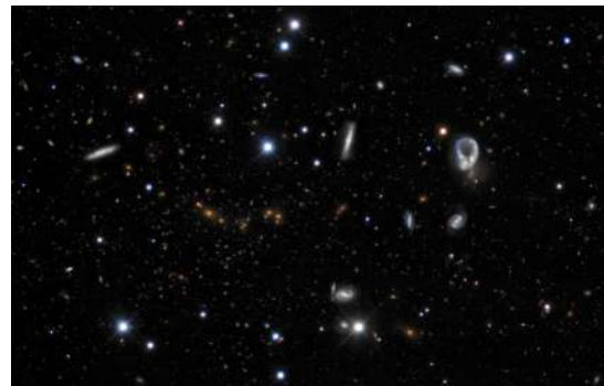
Antes de 1923, los astrónomos veían manchas luminosas y difusas similares sin poder determinar si eran o no parte de nuestra Galaxia. Esta imagen del cielo, obtenida en el Observatorio Interamericano de Cerro Tololo (CTIO) en Chile, muestra la dificultad de distinguir la verdadera naturaleza de los objetos difusos. Licencia: CC BY 4.0.

En cambio, Shapley estudió la distancia a los cúmulos globulares, agrupaciones esféricas de cientos de miles de estrellas. Al estar fuera de la línea de polvo de la Vía Láctea son más fáciles de ubicar que muchas otras nebulosas. Algunos cúmulos globulares contienen estrellas variables con períodos regulares como las Cefeidas, que sirven para medir las distancias aplicando la Ley de Leavitt.